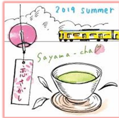
<狭山茶 1袋>※画像はイメージです。

ステップ2 パンフレットに付いている「クーポン券」を、本川越駅直結の西武本川越ペペ1F「西武プリンスクラブカウンター」へお持ちいただいた方全員に、恋さがしキャンペーンオリジナルパッケージ「狭山茶」1袋（ドリップタイプ）をプレゼント。