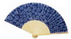
「扇子」※画像はイメージ

※西武鉄道での「恋さがし」キャンペーン(狭山茶プレゼント)および館内の一部装飾のみ、7月27日(土)より実施。