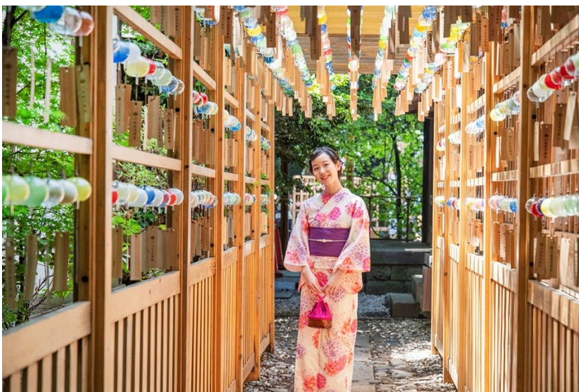
川越氷川神社 縁むすび風鈴&恋あかり