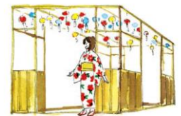
川越氷川神社「縁むすび風鈴」を再現(イメージ)