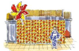
風車スポット(イメージ)