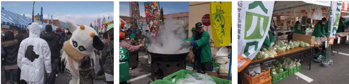
昨年の「ナスハク・バザール」内の様子。那須野巻狩鍋や那須の新鮮野菜の販売を実施。

4月中は那須・黒磯・塩原エリアのホテルや旅館、レジャー施設など31箇所でも様々なイベントや特別企画などを実施します。(※個別会場それぞれで期間・内容が異なります。)