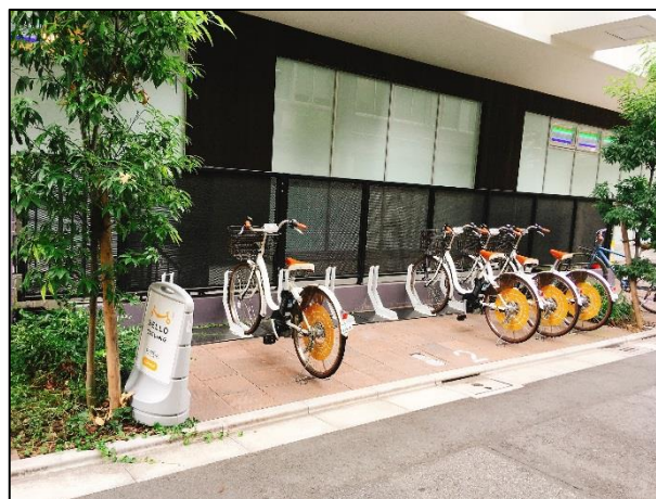
ステーションイメージ

また、今後西武プロパティーズが管理する各種ビル・施設、西武線沿線へのシェアサイクル導入を検討してまいります。