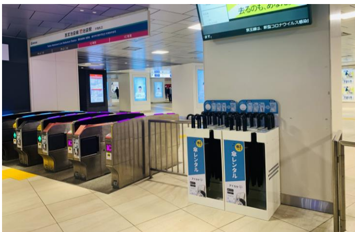
傘立て設置の様子(池袋駅)

この度の設置拡大により、沿線にお住まいのお客さまのさらなる利便性向上に加え、電車内・駅構内での傘のお忘れ物の削減、それにともない廃棄されるビニール傘の数の削減を通じて、環境の保護においても貢献してまいります。