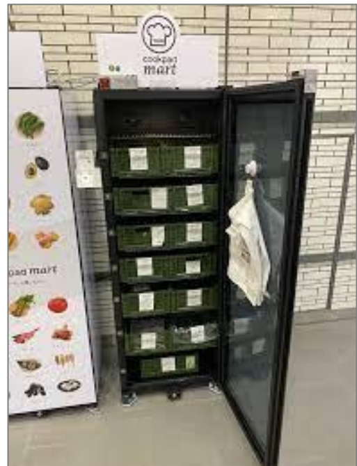
設置ロッカー（イメージ）