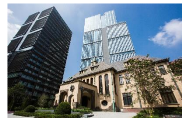
東京ガーデンテラス紀尾井町