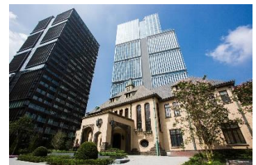
東京ガーデンテラス紀尾井町